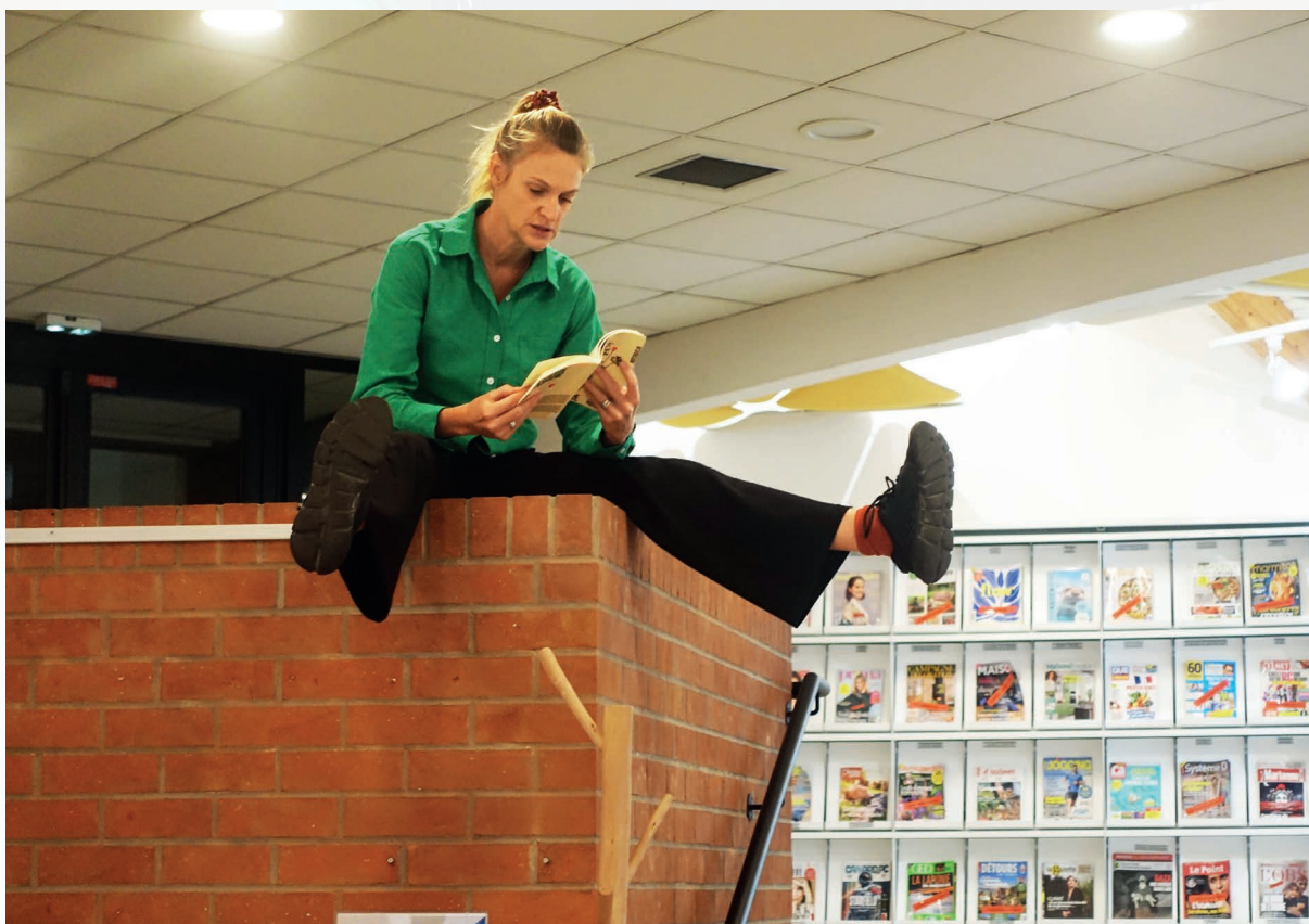
Résidence à la Médiathèque et au Théâtre de Jouy-le-Moutier

L'équipe artistique de Frichti Concept se rend dans les médiathèques pour s'imprégner des textes du catalogue de chacune d'entre elles et travailler en collaboration avec les médiathécaires sur les ouvrages et leur rapport au métier. Ce travail avec l'équipe de la médiathèque influe sur le choix des œuvres littéraires, le choix des lieux investis, voire la proposition sonore in situ à travers les enregistrements. Cela permet d'explorer en direct le rapport danse et texte au plus près des espaces. Ces temps d'expérimentations s'effectuent à la fois pendant les moments d'ouverture au public et les moments de fermeture. Les recherches chorégraphiques se font sans venir troubler le bon fonctionnement de l'équipement culturel, en alternant des temps où les danseur·euses sont présent·es au côté des usager·ères en train de lire et des temps de travail en toute autonomie . Des ateliers avec les publics de type Escapades artistiques (écriture et danse) ou des ateliers d'écriture en mouvement peuvent aussi être proposés. Chaque résidence fera l'objet d' impromptus artistiques et d'une restitution publique lors d'un rendez-vous convoqué ou non.